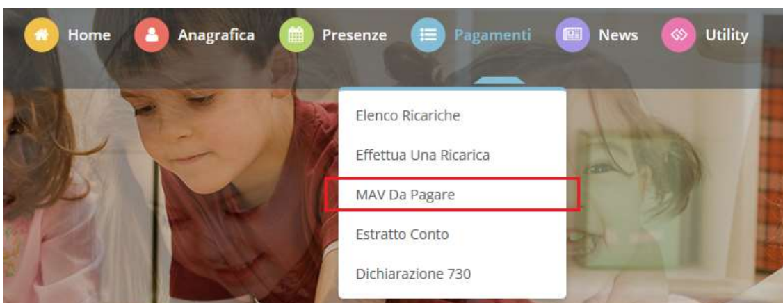
Figura 4 – Elenco MAV da Pagare

Si ricorda inoltre che il MAV, una volta effettuato il pagamento, sarà visualizzabile tra le vostre ricariche effettuate entro 24/48 ore.