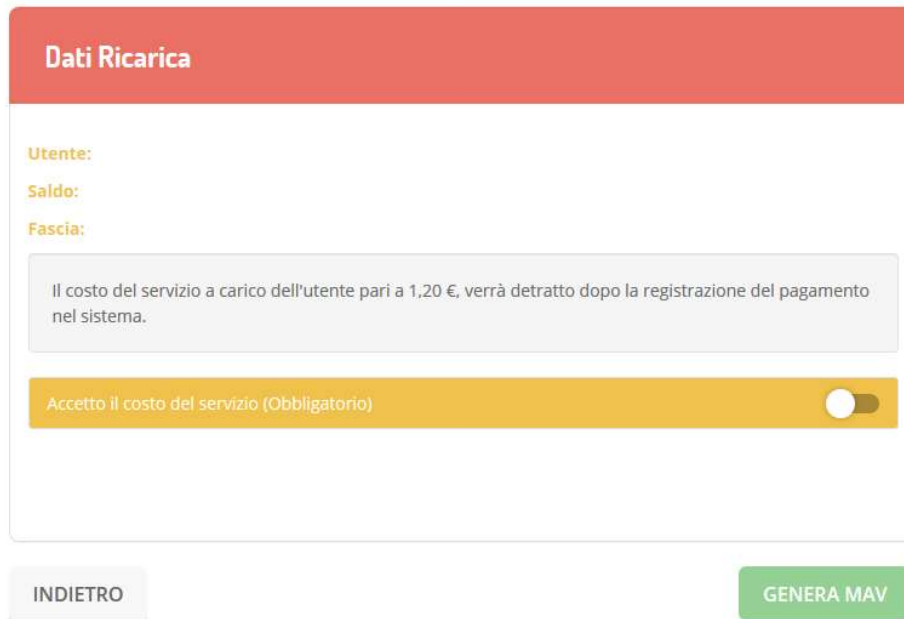
Figura 3 – Dati Ricarica